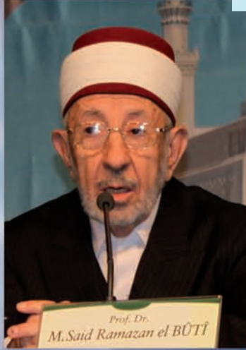
أ.د. محمد سعيد رمضان البوطي