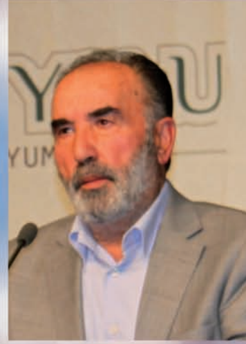
أ.د. خير الدين كارامان