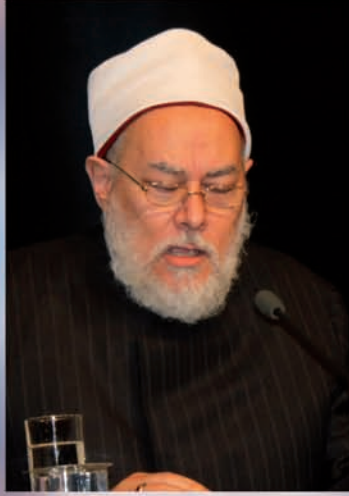
أ.د. علي جمعة