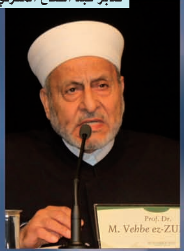
أ.د. وهبة الزحيلي